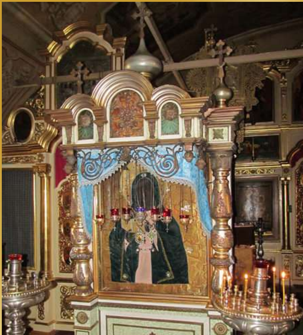
Калужская икона Божией Матери в Свято- Георгиевском соборе г. Калуги