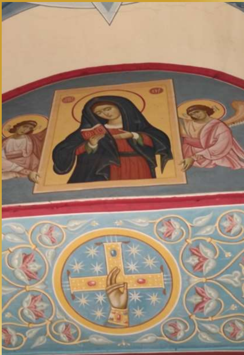
Фреска в Троицком кафедральном соборе г.Калуги.