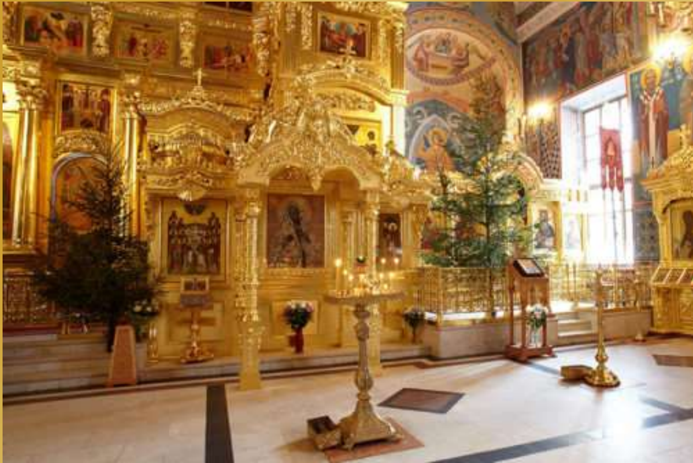
Калужская икона Божией Матери в Свято-Троицкой Сергиевой лавры г. Калуги.